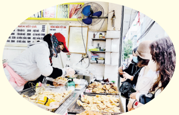
Du khách chọn mua hải sản tại chợ Cái Dăm.