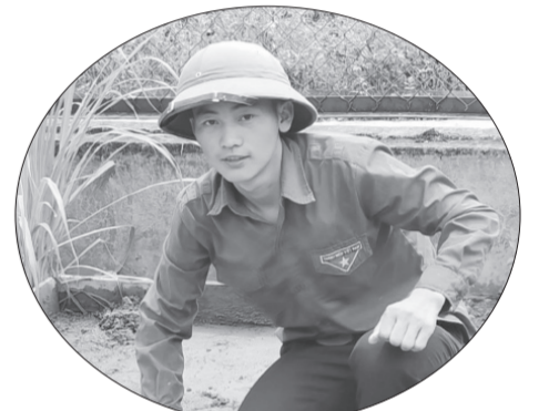
"Thủ lĩnh" đoàn Vàng A Đông.

Dù bản thân cũng không có cuộc sống dư dả nhưng anh sẵn sàng chi tiền túi để giúp đỡ những thanh niên yếu thế. Anh còn kêu gọi ủng hộ 1 thanh niên chậm tiến và vận động 2 hộ thanh niên phát triển chăn nuôi, thoát nghèo thành công.