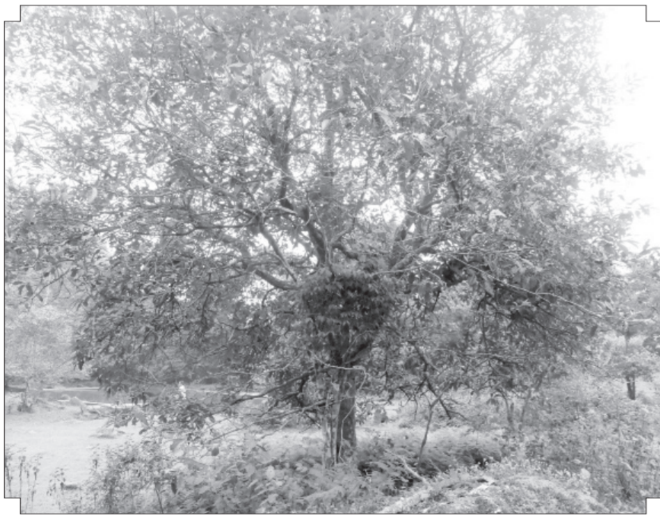
Những cây chè cổ thụ đã bám rễ hơn một thế kỷ ở Ngải Chồ.

Theo chân ông Lù, từ trung tâm thôn mất khoảng 30 phút đi bộ trên đường mòn, xuyên qua cánh rừng vầu tự nhiên, hiện trước mắt chúng tôi là hàng trăm cây chè cổ thụ xếp đan nhau trên khoảng đất vài héc-ta bằng phẳng như thảo nguyên. Những cây chè không quá cao nhưng phần gốc rất to và thân được chia thành nhiều nhánh. Đưa bàn tay lần sờ theo những vết rạn, vết sần trên thân, ông Lù bảo: Thảm thoát đã 60 năm kể từ lần đầu đặt chân tới rừng chè cổ này. Từ ấy thời gian trôi qua nhưng những cây chè cổ thụ dường như không có quá nhiều sự thay đổi về hình dáng và kích thước thân, vẫn sừng sững giữa núi rừng, có chăng là vết mốc của thời gian đã phủ dày hơn, loang rộng hơn.