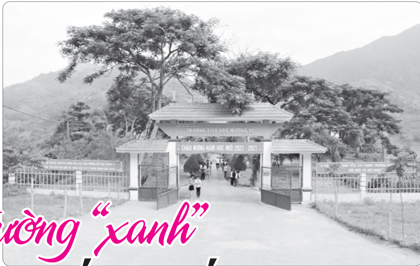
Cổng trường rợp màu xanh cỏ cây, hoa lá.