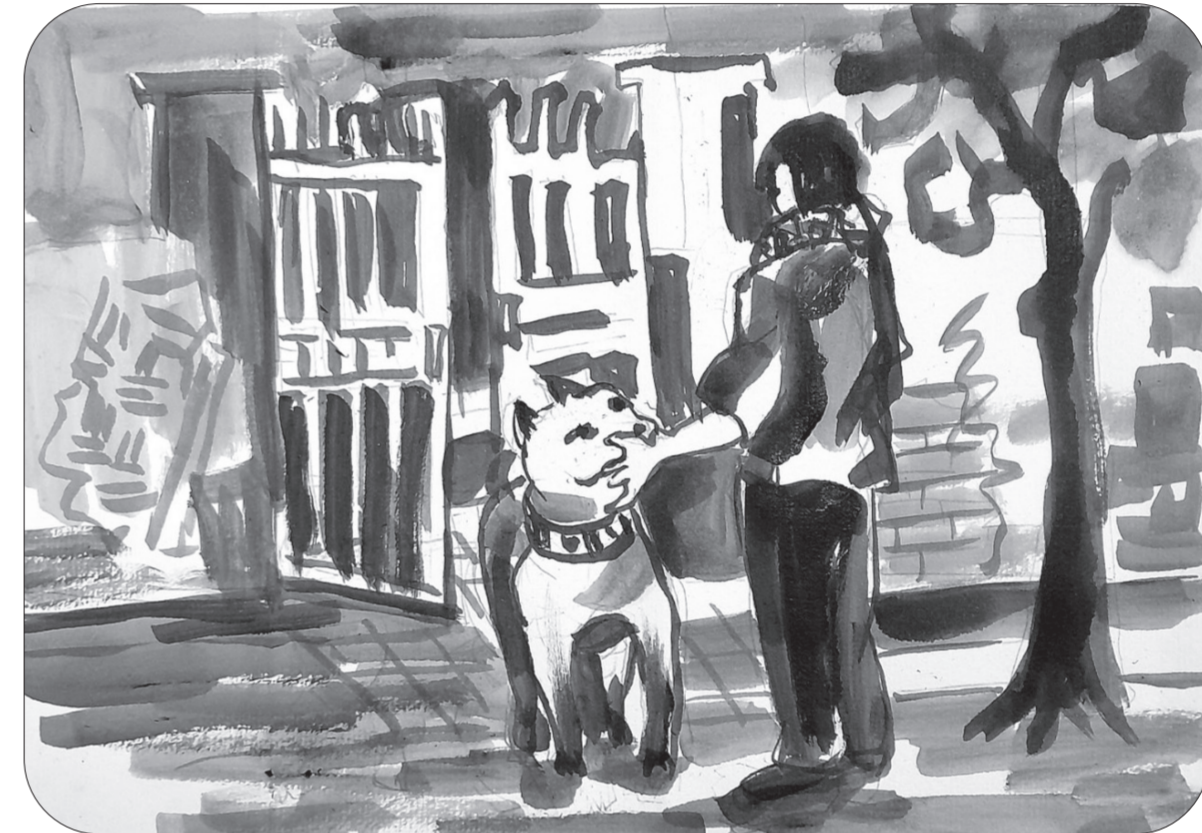
Minh họa của NGUYỄN XUÂN CHIẾN (Phân hiệu Đại học Thái Nguyên tại Lào Cai)

đàn ông và con chó có những cử chỉ thân thiện, ông chủ sa sầm mặt, thở đầu ra, quát: "Chúng mày không ra lời con Luých vào. Đồ ăn hại!"