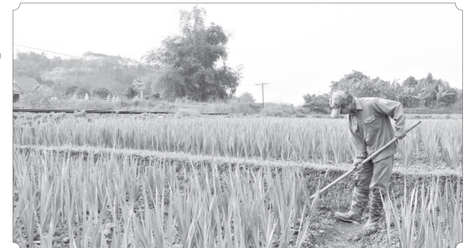
Nhiều diện tích hoa lay ơn ở xã Thái Niên bị tấp lá.