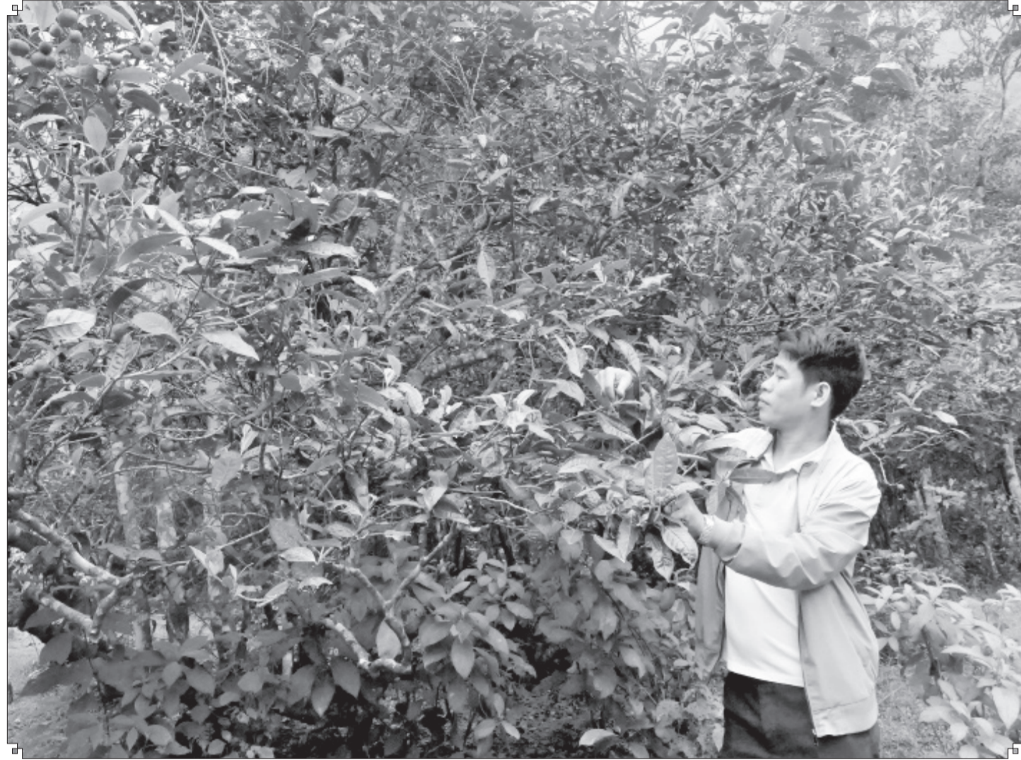
Với người dân Ngải Chồ, những cây chè cổ thụ chính là báu vật.

Nằm bên dòng thác Tiên thơ mộng, rừng chè cổ thụ thôn Ngải Chồ, xã Dền Sáng (huyện Bát Xát) được người dân bảo vệ như báu vật.