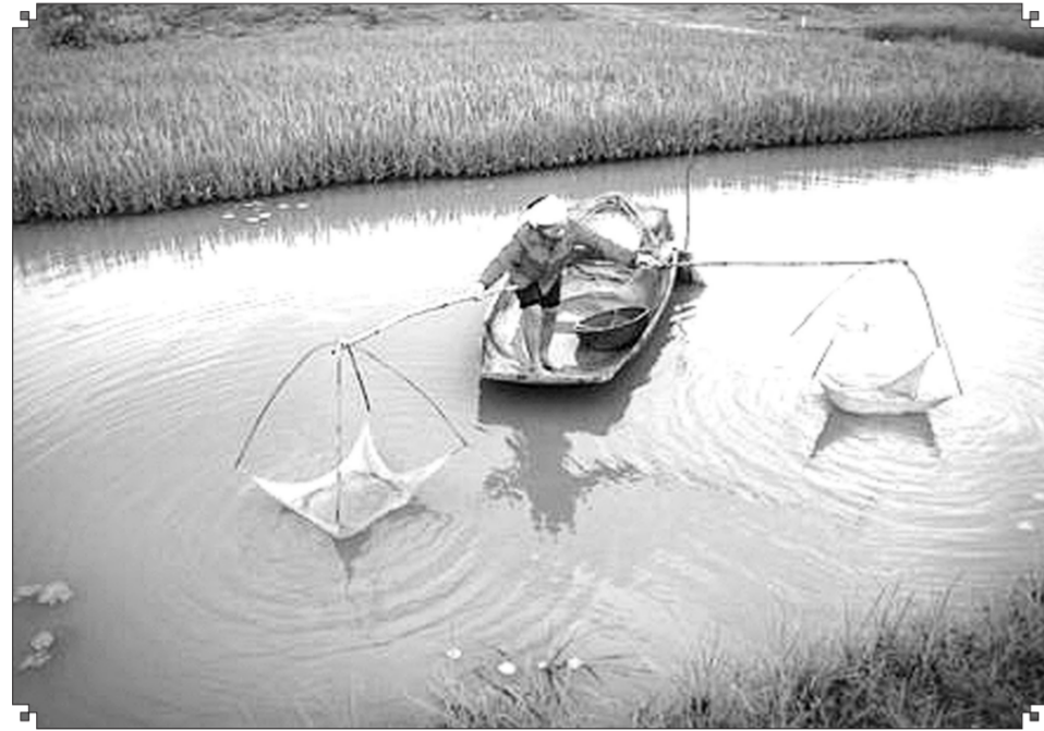
(Ảnh minh họa)

Ngày tôi còn nhỏ, gia đình làm nghề nuôi cá giống. Những con cá trắm, chép, trôi mới nở lấm tấm chỉ như đầu tăm (gọi là cá bột) được thả xuống ao và chăm sóc vất vả chẳng khác gì nuôi con lợn. Khi cá lớn dần bằng đầu đũa, bằng ngón tay và to hơn sẽ được bắt lên bán cho người dân trong vùng về nuôi thành cá thịt. Có những buổi sớm khi gà chưa gáy, cả nhà đã thức dậy lội ao kéo cá bán cho khách ở xa. Cùng với ruộng lúa