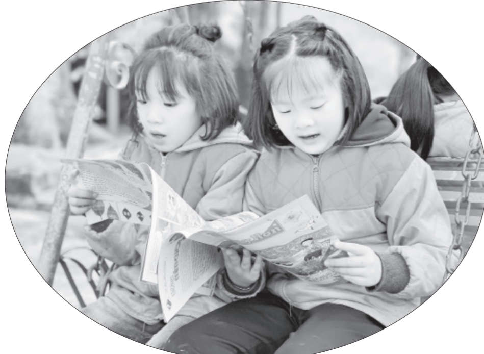
Học sinh đọc sách trong không gian thoáng đãng.

tác phẩm của mình. Thay vì phải ngồi trong lớp để tưởng tượng, để tự nghĩ ra cảnh vật, được vẽ tranh ngoài trời giúp các em có cái nhìn thực tế hơn, trực diện hơn.