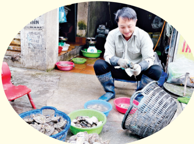
Hải sản được sơ chế ngay tại chợ.

Nằm ở vị trí trung tâm của thành phố biển, bên cạnh các khu nghỉ dưỡng, khu du lịch nên chợ Cái Dăm luôn nhộn nhịp người qua lại. Trong hành trình đưa khách, dẫn tour tham quan mảnh đất Hạ Long xinh đẹp, các hướng dẫn viên đều đưa chợ Cái Dăm vào lịch trình và nhận được phản hồi tốt từ du khách. Để rồi như một slogan mời gọi cho du lịch địa phương, những hướng dẫn viên vui nhộn thường dặn dò du khách trước giờ tạm biệt: Đến Hạ Long nhớ về chợ Cái Dăm.