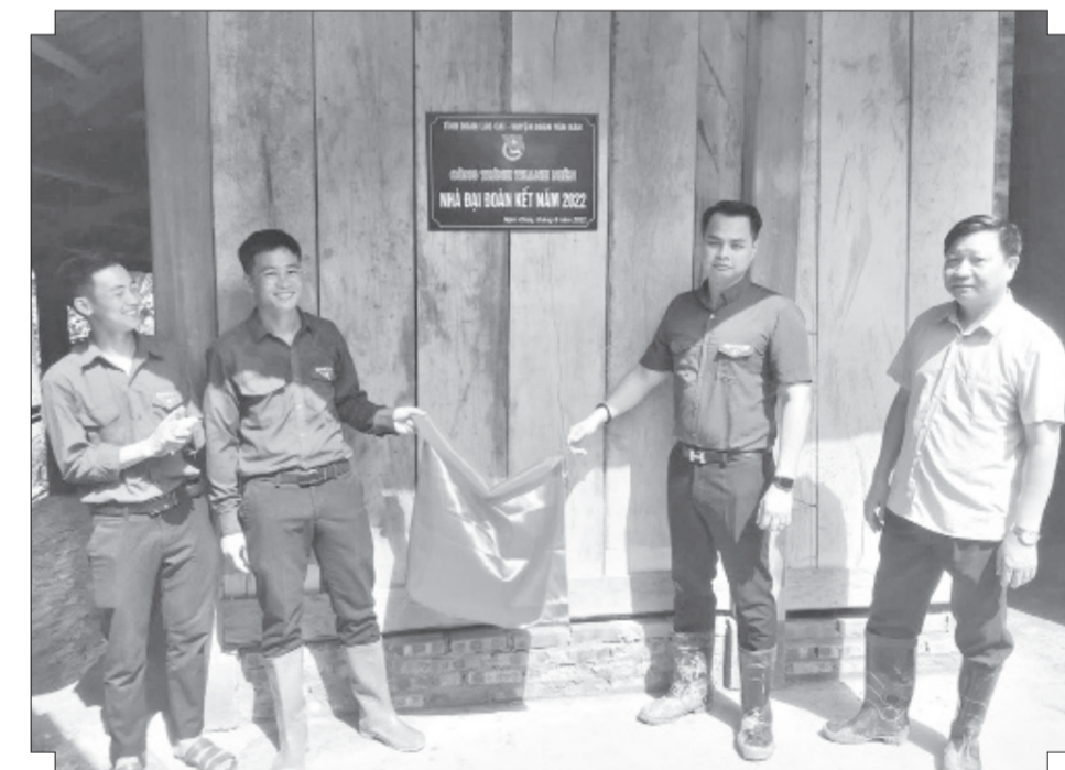
Bàn giao nhà "Đại đoàn kết" cho đoàn viên, thanh niên có hoàn cảnh khó khăn.

Anh Đông không chỉ làm tốt vai trò kết nối thiện nguyện, mà còn tích cực trong tổ chức những hoạt động hướng về cơ sở, giúp đỡ, mang niềm vui đến bà con vùng cao nơi đây. Năm vừa qua, Đoàn Thanh niên xã Nậm Chày