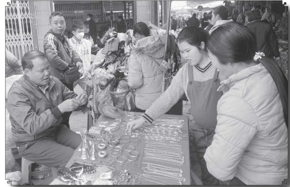
Một góc chợ phiên thị trấn Mường Khương ngày cuối năm.

“Áo trẻ em may sẵn thì từ 150 đến 180 nghìn đồng một chiếc, áo người lớn từ 200 đến 230 nghìn đồng, còn áo nam giới, áo cho các cụ cao tuổi thì 300 nghìn đồng, các loại vải bán theo mét... Người biết may thường mua vải mang về tự may, người không biết may thì mua áo may sẵn. Ngày trước chủ yếu bán vải, giờ người biết may ít, lại mất thời gian cả tuần trời, nên chủ yếu khách mua áo may sẵn” - bà Phượng tươi cười