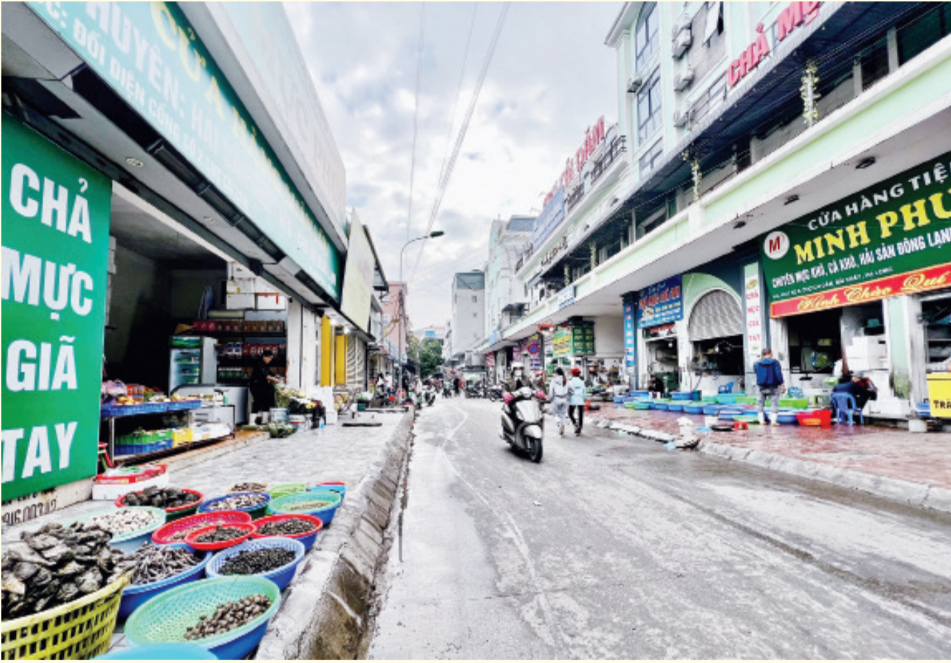
Tuyến phố vành đai của chợ Cái Dăm ken kín các cửa hàng bán hải sản.

Thành phố Hạ Long, tỉnh Quảng Ninh lâu nay vẫn hấp dẫn du khách bốn phương bởi thắng cảnh thiên nhiên kỳ vĩ, con người thân thiện, mến khách. Đến với vùng biển, du khách không chỉ được thả hồn với mênh mông gió lộng, những con sóng ào ạt xô bờ, mà còn có thể thỏa sức khám phá những sản vật của vùng nước mặn. Đặc biệt, nếu muốn mua những sản vật ấy về làm quà cho gia đình, bè bạn, một trong những địa điểm không thể bỏ qua, đó là chợ Cái Dăm.